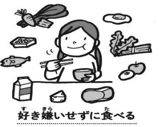
好き嫌いせずに食べる