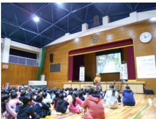
【心に感じる講演会】

昨年引き続きお越しいただいた登天ポールさんの人権講演会では、「いじめ撲滅」「いつも心にマウンテン」を合言葉に全国を回って活動されているお話や、外国での活動についてのお話も聞かせていただきました。歌や振付けが、子ども達に親しみやすく、大切なメッセージも心にすっと入ってきます。子ども達の感想の一部を紹介します。