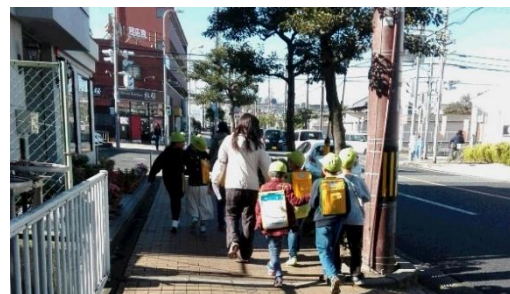
↑ファミマ&紅桜&ネッツチーム

11/10(金) 少人数グループに分かれて近隣地域のお店を見学・インタビューを行うため引率をしました。コーナン・がんこ・TSUTAYA 等、普段とは違う目線にワクワク、発想豊かな質問に、お店の人もタジタジ。裏話も色々聞け、とてもためになる社会勉強になったと思います。PALNET 児童書のコーナーに、お店宛ての子供たちが書いたお礼の手紙が掲示されているのを見つけました★