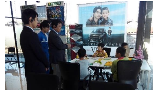
↑ネッツヨタチーム