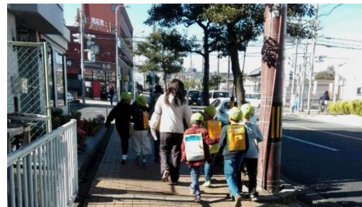
↑ファミマ&紅桜&ネッツチーム

11/10(金)少人数グループに分かれて近隣地域のお店を見学・インタビューを行うため引率をしました。コーナン・がんこ・TSUTAYA等、普段とは違う目線にワクワク、発想豊かな質問に、お店の人もタジタジ。裏話も色々聞け、とてもためになる社会勉強になったと思います。PALNET 児童書のコーナーに、お店宛ての子供たちが書いたお礼の手紙が掲示されているのを見つけました★