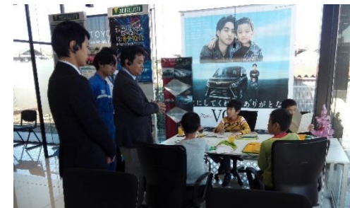
↑ネッツヨタチーム