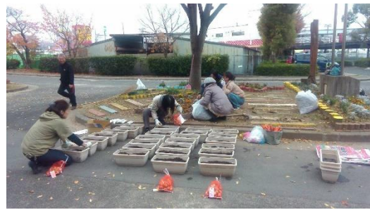
↑11/28 チューリップ球根植えの様子