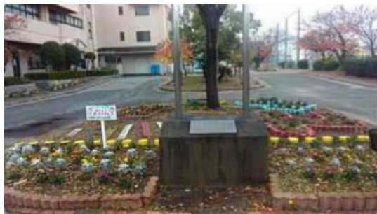
↑看板が立ちました！！