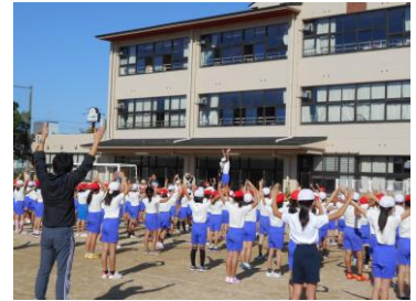
【全校でラジオ体操の練習】

10月に入りました。一昨日に予定していた休日参観、環境整備、引渡し訓練が台風24号接近のため中止となり、大変残念でした。保護者の皆様におかれましては、お子様の学習の様子を見るのを楽しみにしていただいていたことと思います。今後の運動会、1月18日（金）のまるごとパック学校公開、1月下旬から始まる各学年の学習発表会で、子どもたちの成長を見ていただきたいと思います。引き渡し訓練につきましては、詳細が決まりましたら後日連絡させていただきます。平日の実施となりますので、可能な限りの参加をお願いします。